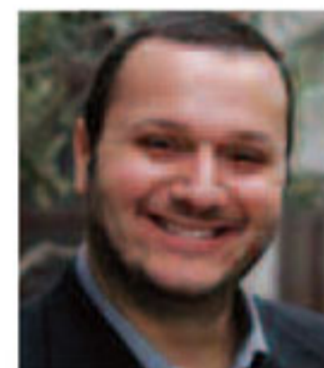
Του Σταύρου Καζαντζόγλου

Όλα δείχνουν πως δεν αργεί η ώρα που θα διαβούμε αυτές τις πύλες. Κοντοζυγώνει η στιγμή που θα μπούμε μέσα στα «κιτρινόμαυρα» τείχη και από εκεί θα εκκινήσει η ολική επαναφορά της ΑΕΚ. Είναι σημαντικό να είναι όλοι εκεί. Το σλόγκαν πολλά από λίγους και λίγα από πολλούς πρέπει να συγκεντρώσει ολόκληρη την «κιτρινόμαυρη» κοινωνία. Να μη λείψει κανείς από το μεγάλο προσκλητήριο.