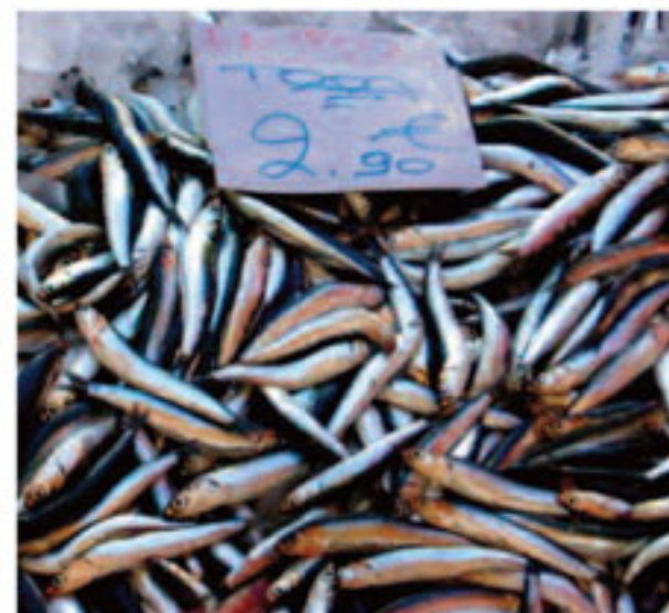
-Τί τρώμε σήμερα μανά; -Γαύρο αγόρι μου...

▶ Πρώτον με τον πρίγκιπα Αλ Αφούζ δεν ασχολείται κανείς, άρα άκυρο... Τώρα αν ο πρόεδρος μαζί με τον Σαββίδη αποφασίσουν να κάνουν κάτι τέτοιο ο Θεός να τους έχει καλά και την