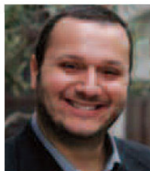
Του Σταύρου Καζαντζόγλου

Τ ελικά, είναι ωραίο αυτό το συναίσθημα. Ελειψε πολύ από την ΑΕΚ τα τελευταία χρόνια, με την ελεύθερη πτώση στο κενό που αναγκάστηκε να κάνει η ομάδα. Ήταν η χειρότερη εξέλιξη για την Ένωση, το μέγιστο κατάντημα να χάνει το ειδικό βάρος της. Είναι γεγονός, πως επιχειρήθηκε